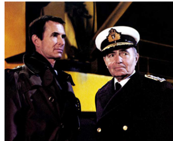
1979 LES LOUPS DE HAUTE MER (North Sea Hijack) d'A. McLaglen avec James Mason