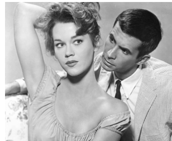
1960 LA TÊTE À L'ENVERS (Tall Story) de Joshua Logan avec Jane Fonda