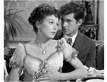
1958 LA MENEUSE DE JEU (The Matchmaker) de Joseph Anthony avec Shirley MacLaine