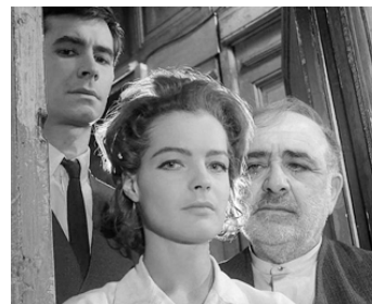
1962 LE PROCÈS (The Trial) d'Orson Welles avec Romy Schneider, Akim Tamiroff