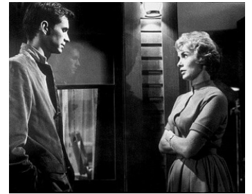
1960 PSYCHOSE (Psycho) d'Alfred Hitchcock avec Janet Leigh