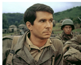
1965 PARIS BRÛLE-T-IL ? de René Clément