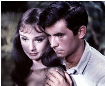
1959 LES VERTES DEMEURES (Green Mansions) de Mel Ferrer avec Audrey Hepburn