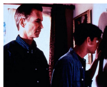
1990 PSYCHOSE IV (Psycho IV, the Beginning) de Mick Garris avec Henry Thomas