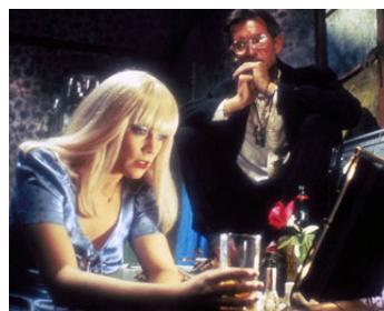
1984 LES JOURS ET LES NUITS DE CHINA BLUE (Crimes of Passion) de Ken Russell avec K. Tumer