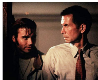
1985 PSYCHOSE III (Psycho III) d'Anthony Perkins avec Jeff Fahey