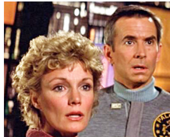
1978 LE TROU NOIR (The black Hole) de Gene Nelson avec Yvette Mimieux