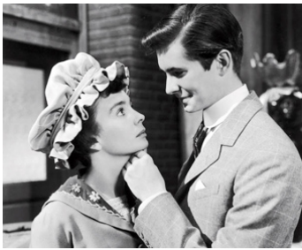
1953 GLOIRE ET FORTUNE (The Actress) de George Cukor avec Jean Simmons