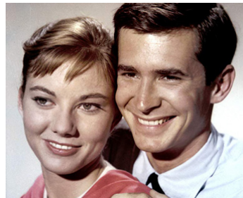
1959 LE DERNIER RIVAGE (On the Beach) de Stanley Kramer avec Donna Anderson