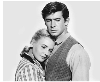
1956 JICOP LE PROSCRIT (The lonely Man) d'Henry Levin avec Elaine Aiken