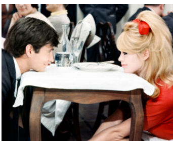
1964 UNE RAVISSANTE IDIOTE d'Édouard Molinaro avec Brigitte Bardot