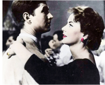
1958 BARRAGE CONTRE LE PACIFIQUE de René Clément avec Silvana Mangano