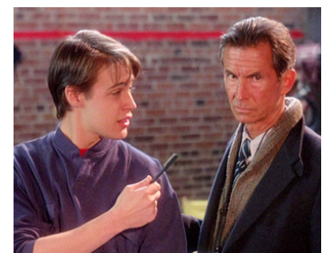
1987 DESTROYER (Shadow of Death) de Robert Kirk avec Tobias Anderson