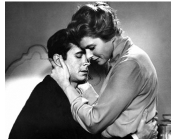
1960 AIMEZ-VOUS BRAHMS ? (Goodbye again) d'Anatole Litvak avec Ingrid Bergman