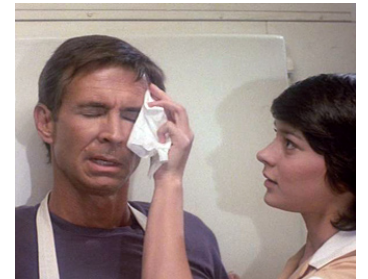
1983 PSYCHOSE II (Psycho II) de Richard Franklin avec Meg Tilly