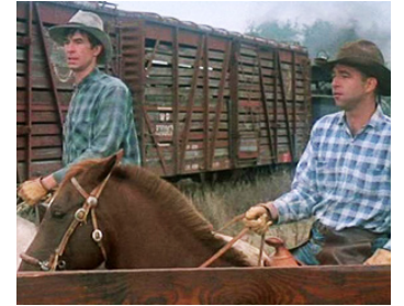
1973 LOVIN' MOLLY (Lovin' Molly) de Sidney Lumet avec Beau Bridges