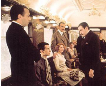
1974 LE CRIME DE L'ORIENT-EXPRESS de S. Lumet avec J-P. Cassel, S. Connery, Ch. Rampling, A. Finney