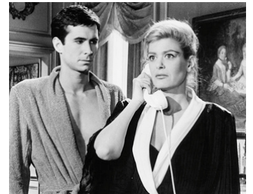
1961 PHÉDRE (Phaedra) de Jules Dassin avec Melina Mercouri