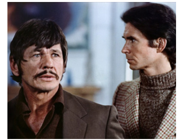
1971 QUELQU'UN DERRIÈRE LA PORTE (Someone behind the door) de N. Gessner avec Ch. Bronson