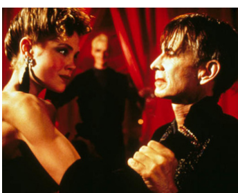
1988 DR JEKYLL & MR HYDE (Edge of Sanity) de Gérard Kikoïne avec Glynis Barber