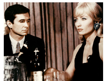
1966 LE SCANDALE de Claude Chabrol avec Stéphane Audran