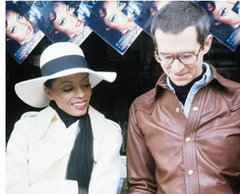
1975 MAHOGANY (Mahogany) de Berry Gordy avec Diana Ross