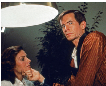
1983 LE PORTRAIT DE DORIAN GRAY (The Sins of Dorian Gray) de Tony Maylam avec Belinda Bauer