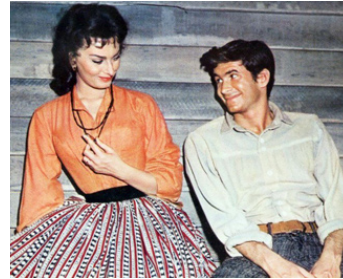
1958 DÉSIR SOUS LES ORMES (Desire under the Elms) de Delbert Mann avec Sophia Loren