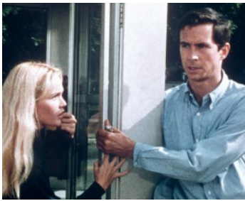
1967 LES PERVERTIS (Pretty Poison) de Noel Black avec Tuesday Weld