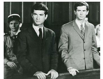
1963 LE GLAIVE ET LA BALANCE d'André Cayatte avec Jean-Claude Brialy