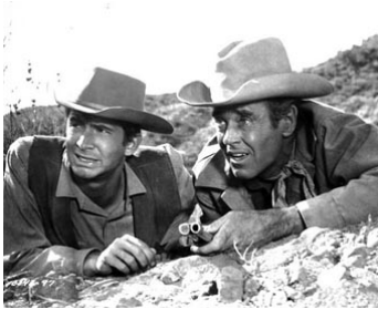
1957 DU SANG DANS LE DÉSERT (The tin Star) d'Anthony Mann avec Henry Fonda