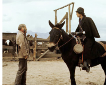
1972 JUGE ET HORS-LA-LOI (Judge Roy Bean) de John Huston avec Paul Newman