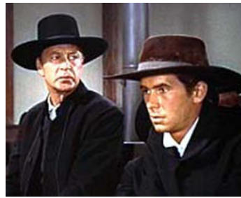
1956 LA LOI DU SEIGNEUR (Friendly persuasion) de William Wyler avec Gary Cooper