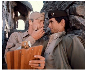
1970 CHATCH 22 (Catch 22) de Mike Nichols avec Jon Voight