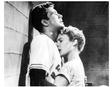
1957 PRISONNIER DE LA PEUR (Fear strikes out) de Robert Mulligan avec Norma Moore