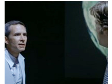
1977 QUI A TUÉ LE PRÉSIDENT ? (Winter Kills) de William Richert avec Jeff Bridges