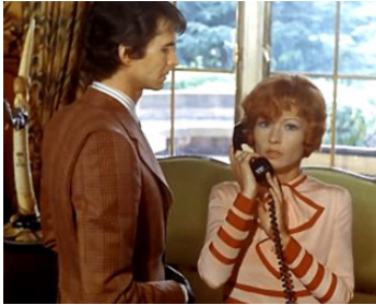
1971 LA DÉCADE PRODIGIEUSE de Claude Chabrol avec Marlène Jobert