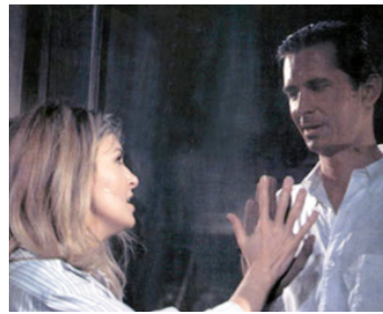
1969 WUSA (W.U.S.A.) de Stuart Rosenberg avec Joanne Woodward