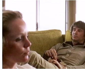
1972 PLAY IT AS IT LAYS de Frank Perry avec Tuesday Weld