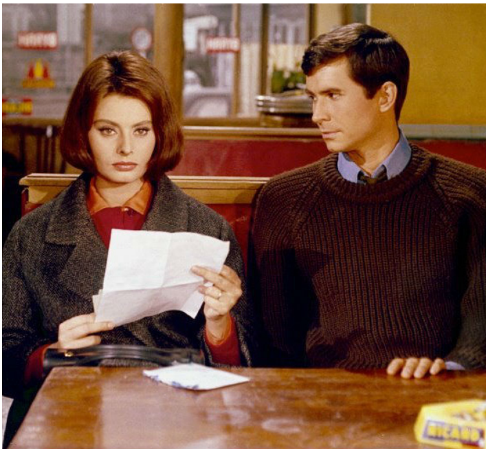
1962 LE COUTEAU DANS LA PLAIE (Five Miles to Midnight) d'Anatole Litvak avec Sophia Loren